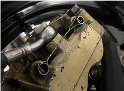
Borgen borgpennen remblokken